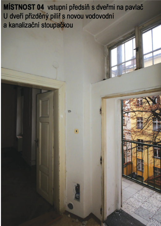
MÍSTNOST 04 vstupní předsíň s dveřmi na pavlač U dveří přizděný pilíř s novou vodovodní a kanalizační stoupačkou