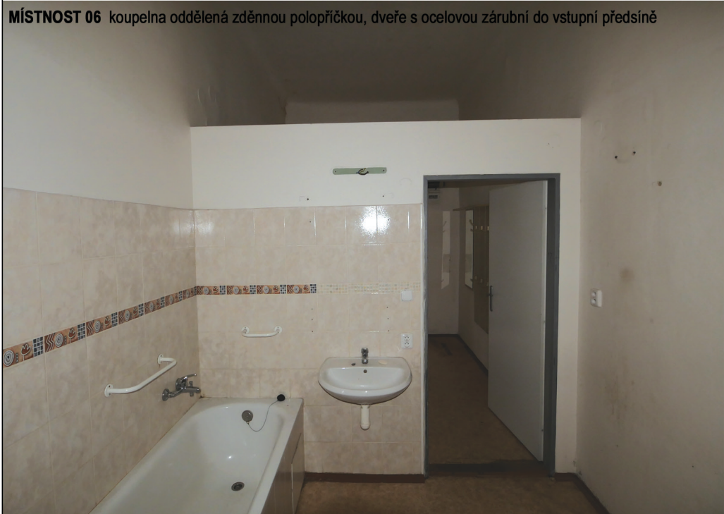
MÍSTNOST 06 koupelna oddělená zděnnou polopříčkou, dveře s ocelovou zárubní do vstupní předsíně