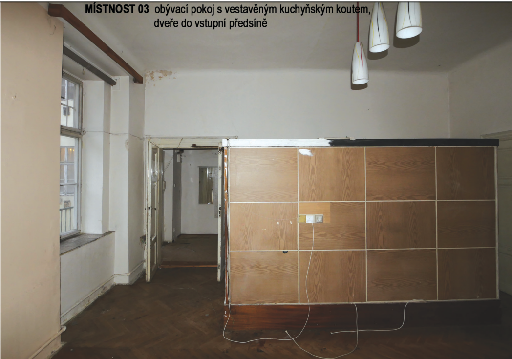
MÍSTNOST 03 obývací pokoj s vestavěným kuchyňským koutem, dveře do vstupní předsíně