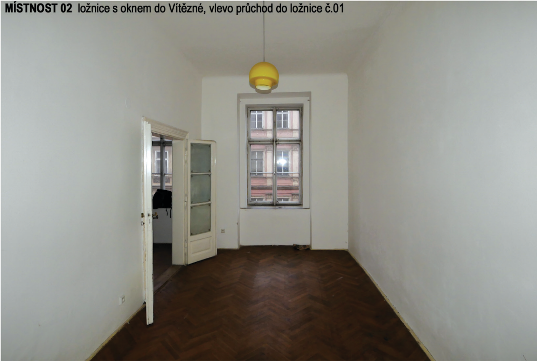
MÍSTNOST 02 ložnice s oknem do Vítězné, vlevo průchod do ložnice č.01