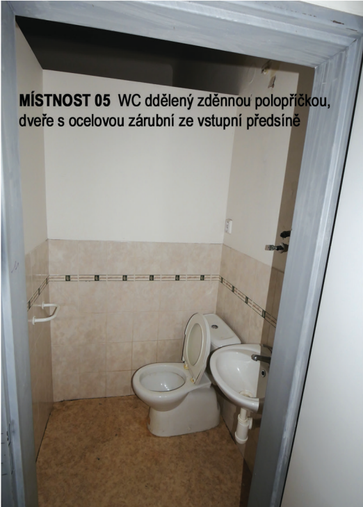
MÍSTNOST 05 WC ddělený zděnnou polopříčkou, dveře s ocelovou zárubní ze vstupní předsíně