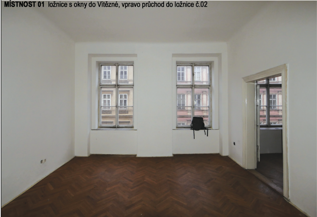
MÍSTNOST 01 ložnice s okny do Vítězné, vpravo průchod do ložnice č.02