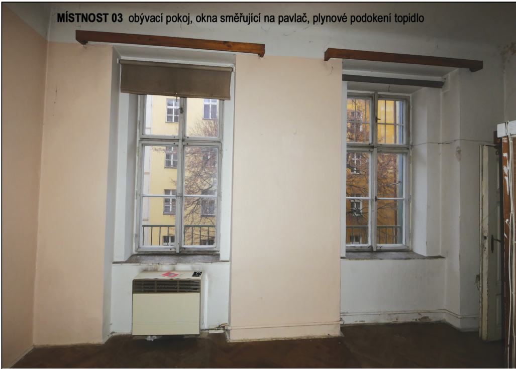
MÍSTNOST 03 obývací pokoj, okna směřující na pavlač, plynové podokení topidlo